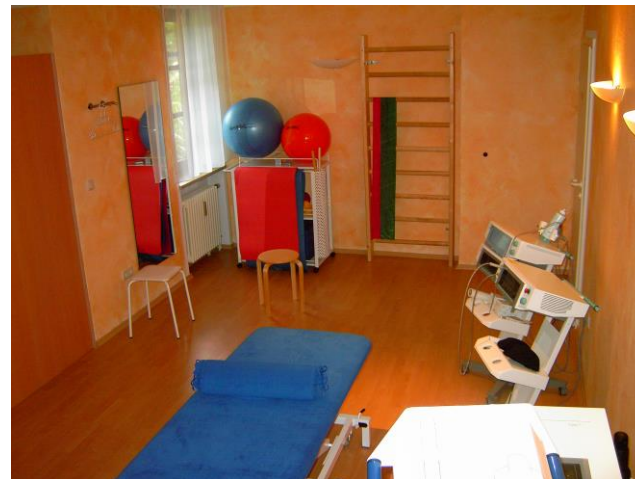
... der Krankengymnastik Behandlungsraum.