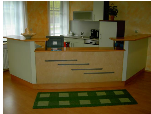
Der Empfangsbereich und ...